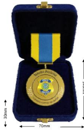
ANEXO III VERSO DA MEDALHA (VENERA, FITA E CAIXA)